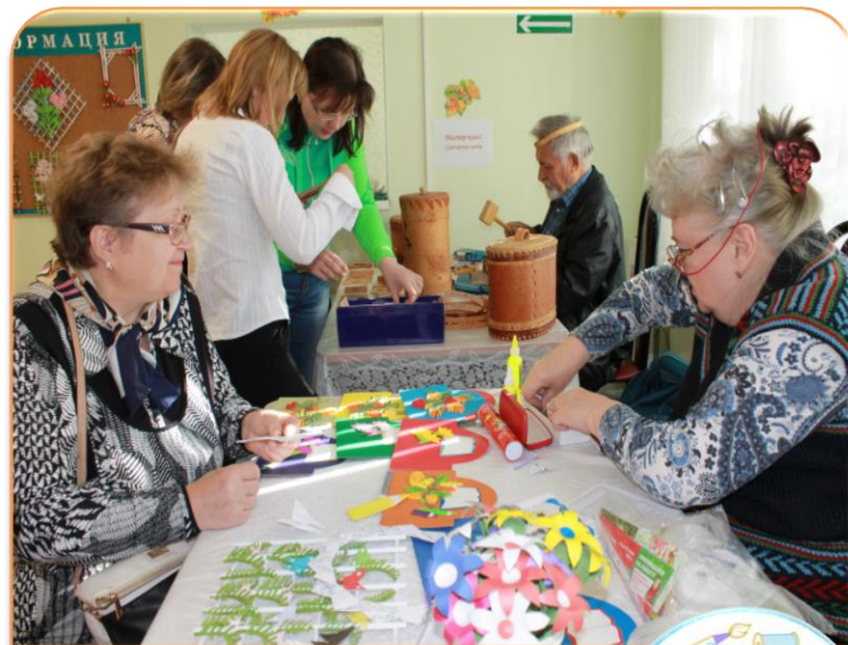
Клуб «Творчество своими руками»