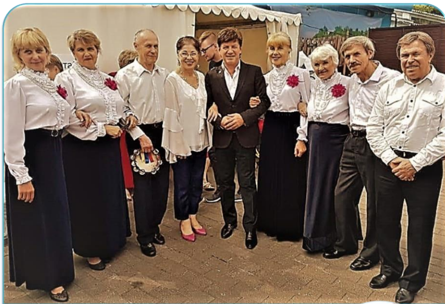
Хоровой клуб «Встреча с песней»